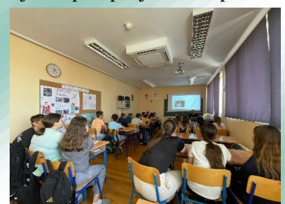
Provođenje natjecanja u učionici Vjeronauka.

U petom kolu školskog pub kviza sudjelovalo je 9 ekipa. Pobjedu je odnijela ekipa Anti-talenti koja vodi na ljestvici sa 193 boda. U stopu ih prate ekipe Zvezdica i Kul mašina. U lipnju nas očekuje posljednje kolo ove godine te ćemo vidjeti koja će ekipa odnijeti cjelokupnu pobjedu ove prve sezone našeg školskog pub kviza.