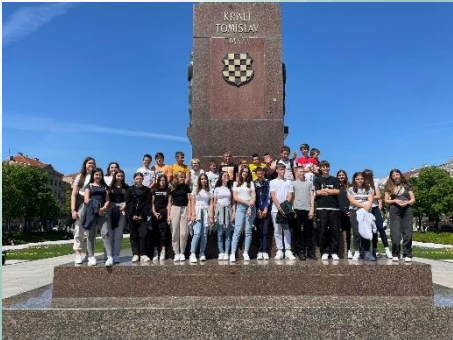
Učenici 7.a i 8.a razreda ispred kipa kralja Tomislava.

Nakon toga su u pratnji razrednika otišli u Arena centar gdje su imali slobodno vrijeme za kupovinu, šetanje i ručak.