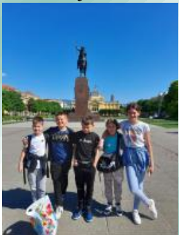
Učenici 4.a razreda u Zagrebu.