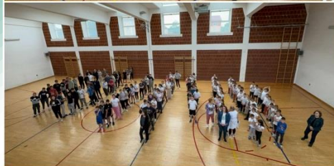
Otvorenje Dana sporta u dvorani.

Na samom kraju dana sporta naši djelatnici škole odigrali su rukometnu utakmicu između učenika.