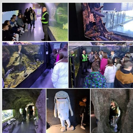
Slatkovodni akvarij „Aquatika“.

Nakon ručka posjetili su slatkovodni akvarij "Aquatika" gdje su naučili ponešto novo o slatkovodnim ribama i podvodnom svijetu.